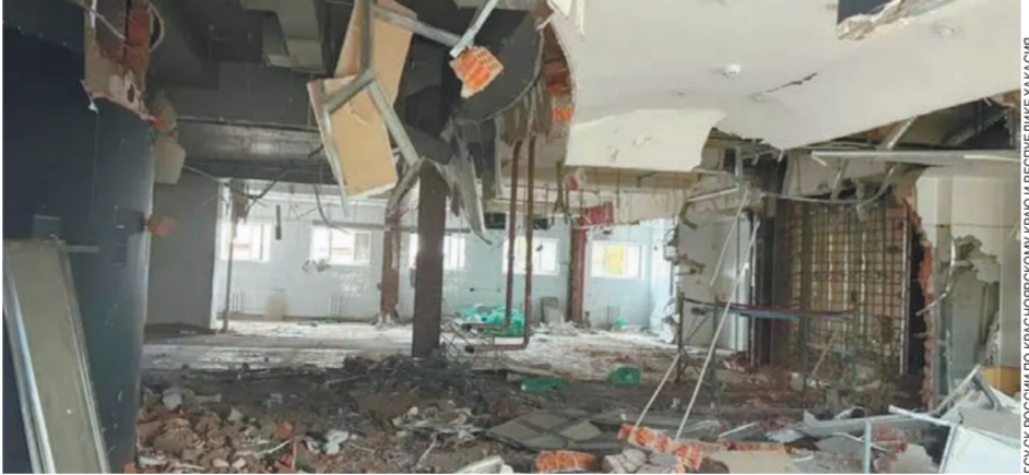
ФОТО: КОПИРОВАНО ПО СПОСОБНОСТИ РЯДОМ ПРЕДУПРЕЖДЕНИЕ КАСКО

По вакансиям «фотограф» спросили портфолио. Я ответила, что фотоаппарат есть, а портфолио еще нет.