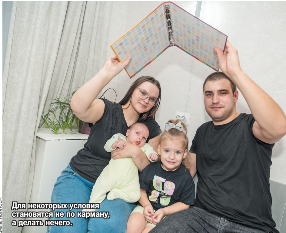
Для некоторых условия становятся не по карману, а делать нечего.

Неделя бесконечного скроллинга объявлений - и ноль результата. После сотен просмотренных вариантов стало ясно: хаотичный поиск ни к чему не приведет. Тогда я взяла ситуацию в свои руки и составила четкий чек-лист требований: до 35 тысяч рублей, однокомнатная либо евродвушка, оснащена необходимой техникой и мебелью. Но рынок аренды - штука коварная. Встречались «евроремонты», где единственным признаком «евро» была наклейка на межкомнатной двери. «Укомплектованная техника» иногда ограничивалась древним холодильником и