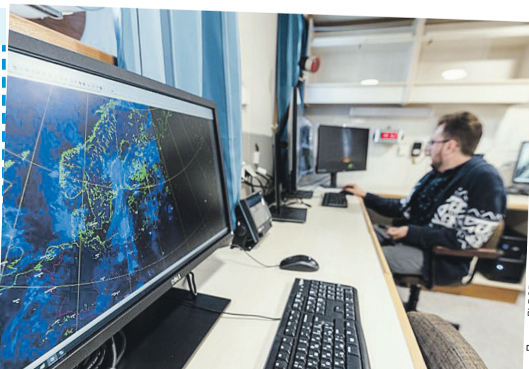
На льдине у платформы (см. фото сверху) создан научный лагерь с множеством приборов, а внутри - теплые каюты и лаборатории для трех десятков ученых. Дрейф начался в сентябре 2024 года и продлится до 2026-го.

- Теплая вода, видимо, ускоряет таяние льда. И большой вопрос, как это будет развиваться. Усилится? Или, наоборот, остановится? - продолжает Осадчиев.