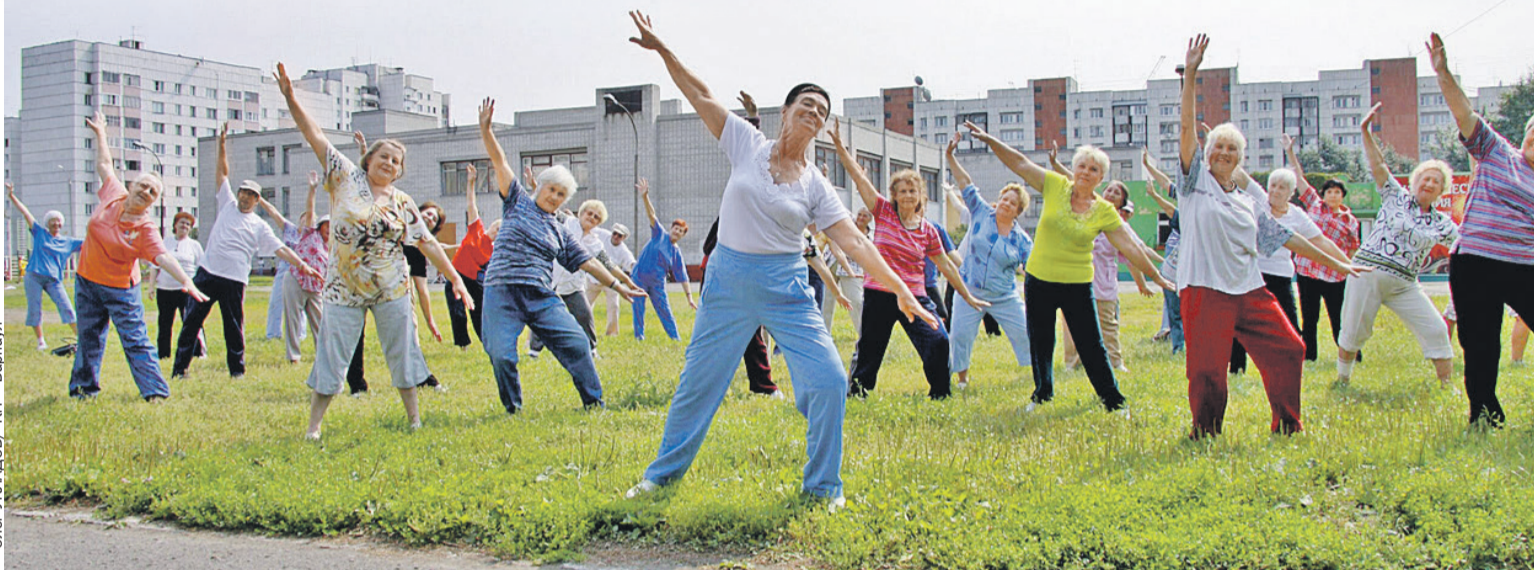
Олег УКОЛОВ/«КП» - Барнаул