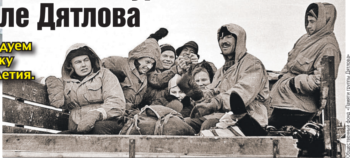
Общественный фонд «Памяти группы Дятлова»

Молодые, веселые, казалось, вся жизнь впереди... И вдруг - такая страшная и таинственная гибель. В этом - одна из причин того, почему эта загадка до сих пор занимает умы людей.